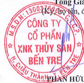
PHẦN HỮU TÀI